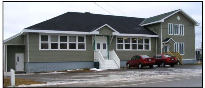
École de Rivière-Saint-Jean