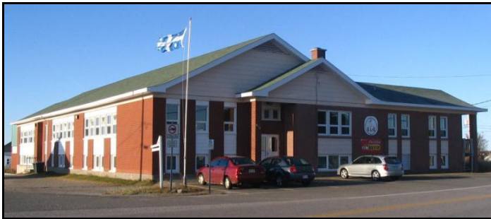
École de Rivière-au-Tonnerre